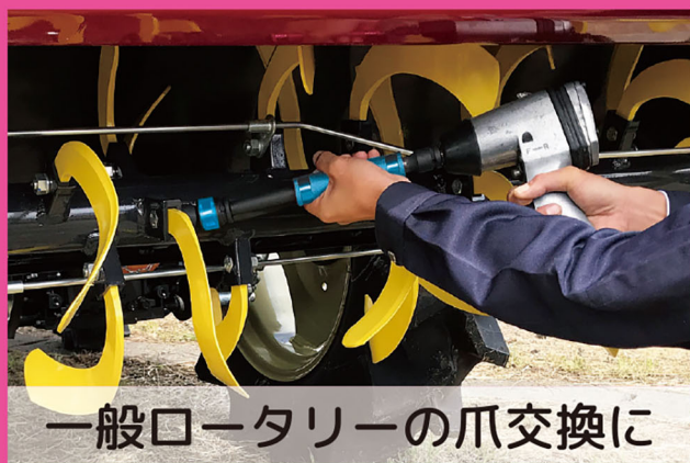
一般ロータリーの爪交換に