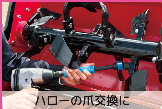
ハローの爪交換に